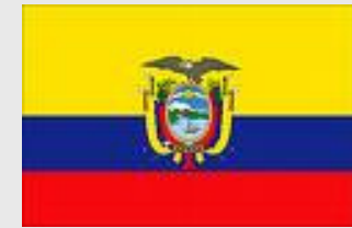
Decisión 486 de 2000, Art, 260