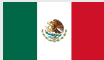
Ley de Propiedad Industrial de México