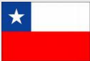
Ley 19996 de 2005