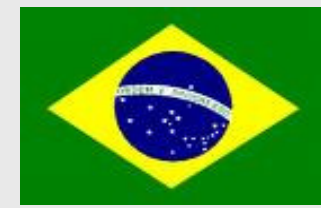
Ley 9.279 de 1996