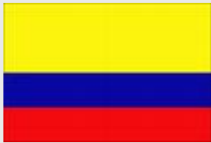
Decisión 486 de 2000, Art, 260