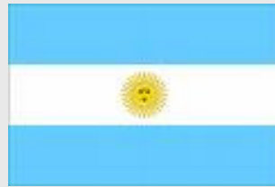
Ley 24766 del 18 de diciembre de 1996